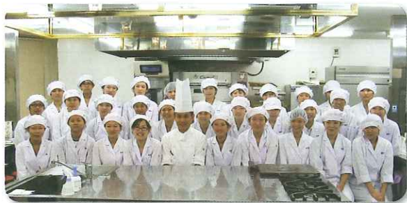
講師と参加した学生さん達

これを機会として、今後多くの若者達が生活衛生業に一層興味を持ち、そして、より多くの若者がこの業界に新たに参加するなど、生活衛生業界がより活発な発展をするよう期待するところです。