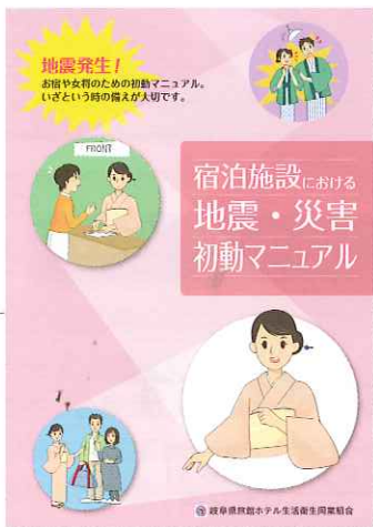
旅館ホテル組合作成 地震災害初動マニュアル A4版 13頁 フルカラー

特に宿泊業を営む私達旅館ホテル組合にとって、いざ災害が発生した場合の第一の課題は、お客さまの身の安全・安心を第一に考えなければなりません。