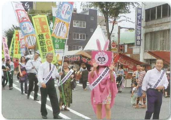
通りをパレードする組合員

社交組合では、岐阜市の「ぎふ信長まつり」において、飲酒運転撲滅、暴力団排除、無許可営業撲滅の啓発のため、組合のオリジナルキャラクター「ピンクうさ交」を先頭に、役員、会員が柳ヶ瀬本通りや歩行者天国を、大パレードしました。また、併せてこのまつりの会場「柳ぶら楽市」において、社交組合オリジナルカクテル「ピンククローバー」のPR販売も行いました。このカクテルは、県内産レングリキュール、長良天然白ワイン等地元材料を組み合わせて作られたもので、飲みやすく、女性を始め愛飲家にも大変好評を博しました。