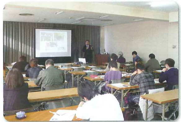
飲食セミナーの様子(岐阜会場)

岐阜県飲食組合の後援により開催されている「飲食店改革セミナー」は、飲食業に携わる意欲ある経営主を対象として、個性や特徴のある店を目指した、集客・売上増大に繋がるそれぞれのテーマを全5回の連続シリーズで県下4会場(岐阜・大垣・多治見・高山)において開催されています(1月29日まで)。今回は「お客様の目線で考える好印象の店舗づくり」をテーマに、店舗づくりの魅力あるデザイン、レイアウト等について、名古屋で活躍されている店舗設計のトータルプロデューサーの方に講演を頂き、多数の方が熱心に受講されました。