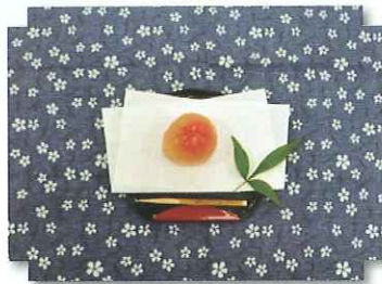
粉もんグランプリ作品 「プルッとまとの水まんじゅう」

ファイナルラウンドに進んだ料理は、今後飲食組合加盟店で商品化を検討していきます。