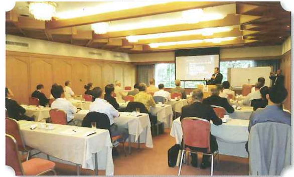
感染症等について熱心に聴講される方々

続いて、県生活衛生課長から「生活衛生営業における衛生確保のポイント」と題して、最近課題となっている食中毒や感染症等の現状と予防対策について、詳細に説明があり特相員の方々は、自らの営業に関わる身近な問題として、メモをとったりして熱心に受講しておられました。