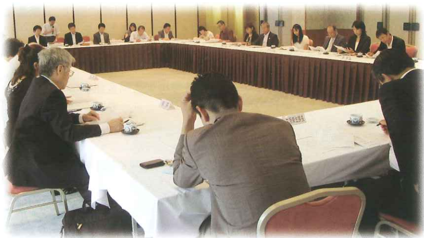
組合の組織強化対策について集中的に協議

このような状況のなか、この「センターだより」前号(第60号)にも、組合の加入促進活動の一部について既にご紹介したところですが、今回、さらに各組合と行