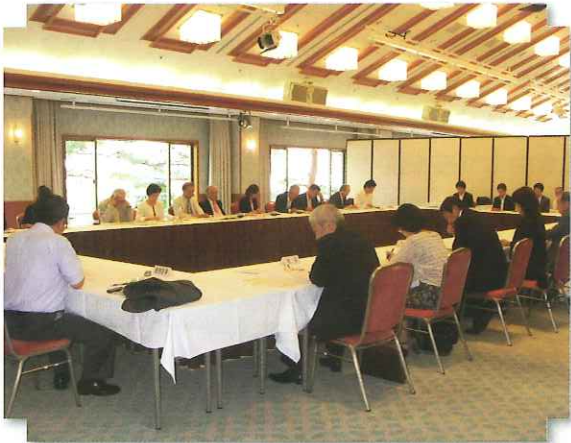
融資の活用策等について協議

会議は、生活衛生貸付の全国及び本県の利用状況、振興事業貸付や衛経資金貸付制度等について、日本政策金融公庫から説明と、公庫融資のさらなる利用促進について要請がありました。