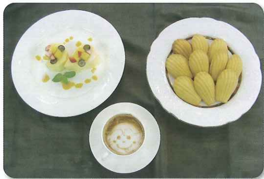
実習成果(スイーツとラテアート)

続いて、(株)セレス専務取締役から「コーヒーの知識」と題して、コーヒーの原産地や品種・特徴及び焙煎・抽出方法等について学びました。