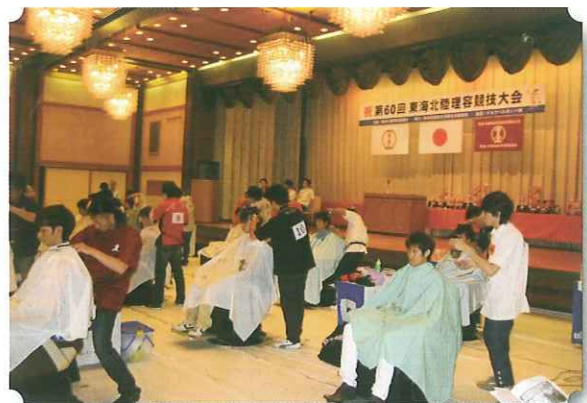
各選手による息詰まる競技

なお、今回は特にエキシビション部門で「クールビズヘア」と「就活ヘア」が披露され、大会に華を添えて頂きました。